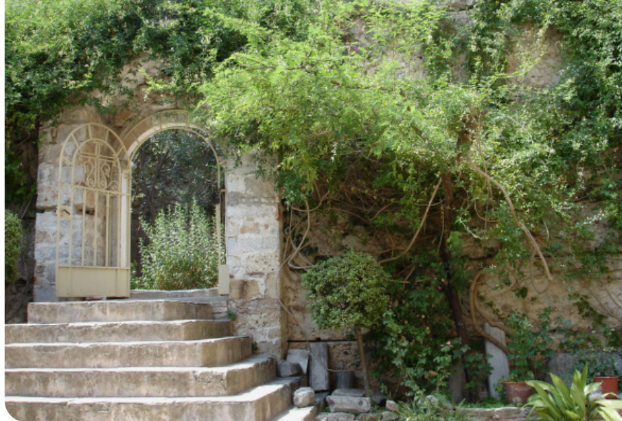
Bekenntnisse sind für die Anbetung: Tor in Mystras, Peloponnes.

Gegenüber einem häufigen Missverständnis gilt es zu beachten, dass im Apostolischen Glaubensbekenntnis die Kirche an diesem Ort genannt wird: Die Kirche, die Gegenstand des Glaubens ist, ist die geistgewirkte Kirche. Diese ist unter den realen und erfahrbaren Erscheinungsformen, an denen man häufig zweifeln und manchmal gar verzweifeln mag, verborgen. Weil sie unseren Augen verborgen ist, muss sie geglaubt werden!