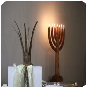
Gottes Wort empfangen, den Retter ehren: In einer Ostschweizer Kirche.

Doch der Mensch lebt nicht vom Brot allein. Jesus hielt das Wort seinem ersten Widersacher entgegen. Er bezog es auf sich, es gilt für uns: Alle leben wir «von jedem Wort, das aus dem Mund Gottes geht» (Matthäus 4,4). Der Kirche muss es darum gehen, dieses Wort weiterzusagen, zum Hören auf dieses Wort anzuleiten, Räume für das Hören und das Besprechen anzubieten und Gott in Christus zu preisen.